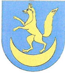
GMINA LISIA GÓRA