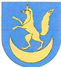
GMINA LISIA GÓRA