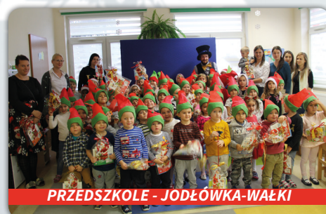
PRZEDSZKOLE - JODŁÓWKA-WAŁKI