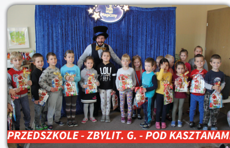
PRZEDSZKOLE - ZBYLIT. G. - POD KASZTANAMI