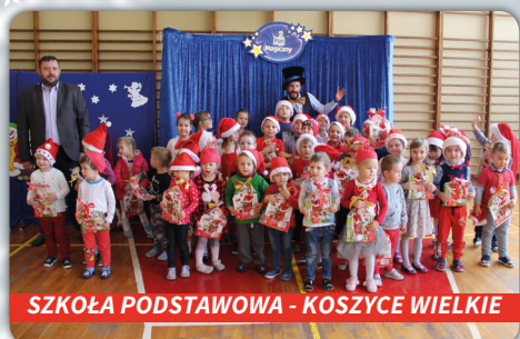
SZKOŁA PODSTAWOWA - KOSZYCE WIELKIE