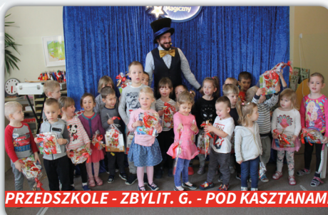
PRZEDSZKOLE - ZBYLIT. G. - POD KASZTANAMI