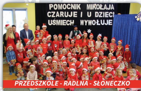
PRZEDSZKOLE - RADLNA - SŁONECZKO