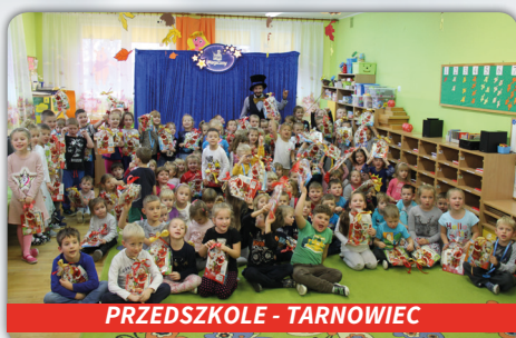
PRZEDSZKOLE - TARNOWIEC