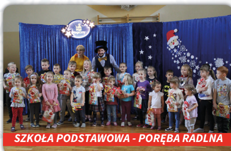
SZKOŁA PODSTAWOWA - PORĘBA RADLNA