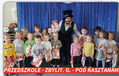
PRZEDSZKOLE - ZBYLIT. G. - POD KASZTANAMI