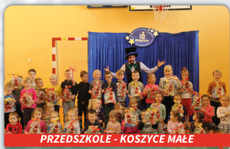
PRZEDSZKOLE - KOSZYCE MAŁE