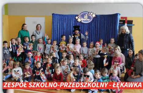
ZESPÓŁ SZKOLNO-PRZEDSZKOLNY - ŁĘKAWKA