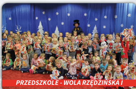
PRZEDSZKOLE - WOLA RZĘDZIŃSKA I