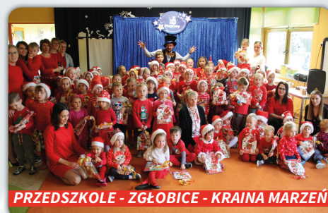
PRZEDSZKOLE - ZGŁOBICE - KRAINA MARZEŃ