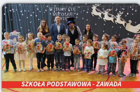
SZKOŁA PODSTAWOWA - ZAWADA