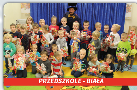
PRZEDSZKOLE - BIAŁA