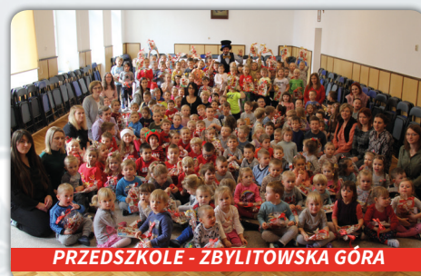
PRZEDSZKOLE - ZBYLITOWSKA GÓRA