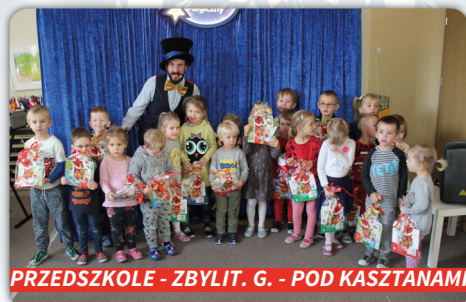
PRZEDSZKOLE - ZBYLIT. G. - POD KASZTANAMI