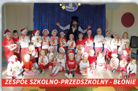
ZESPÓŁ SZKOLNO-PRZEDSZKOLNY - BŁONIE