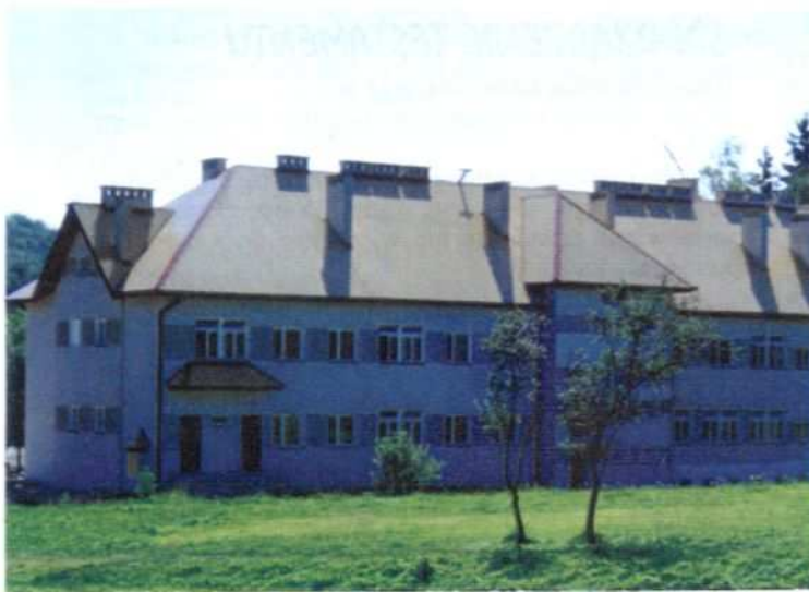
Nowa szkoła w Łękawce największy sukces inwestycji oświatowych obecnej kadencji Rady Gminy Tarnów