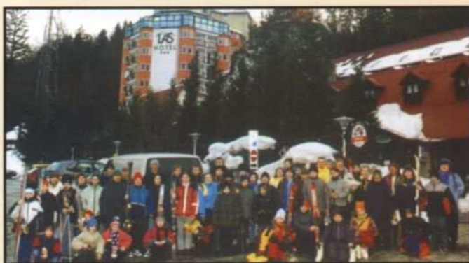
Wyróżnieni uczestnicy świetlicy terapeutycznej ze Zbylitowskiej Góry w Szklarskiej Porębie

W uroczystości wzięło udział wielu znamienitych gości: m.in. Marszałek Sejmu RP Marek Borowski, Wicemarszałek Sejmu RP Janusz Wojciechowski oraz Sekretarz Stanu w Ministerstwie Środowiska Czesław Śleziak.