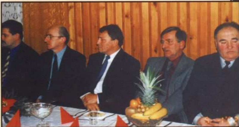
Wicewojewoda Ryszard Półtorak (w środku) uczestniczył w spotkaniu opłatkowym radnych Gminy Tarnów