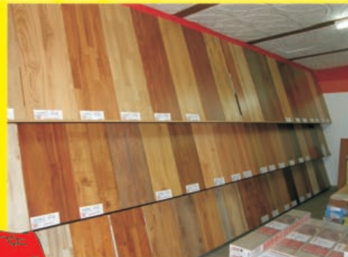
Firma "DOM-MAX" tel. 014 62-96-100