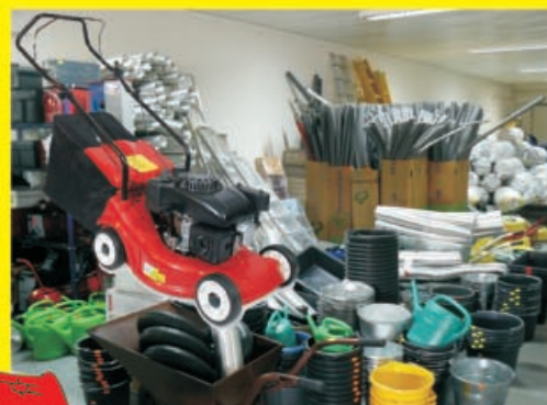
DOM TECHNICZNY ROLNIKA tel. 014 62-96-096