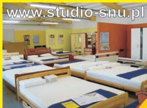
FIRMA "K&D MEBLE" tel. 014 630-02-75