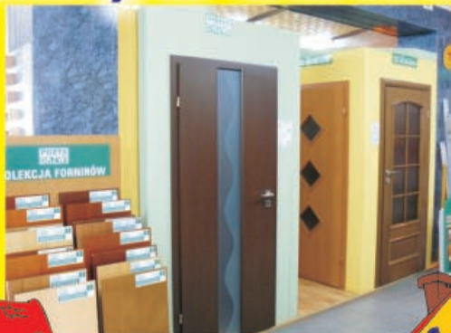
Firma "DOM-MAX" tel. 014 62-96-100