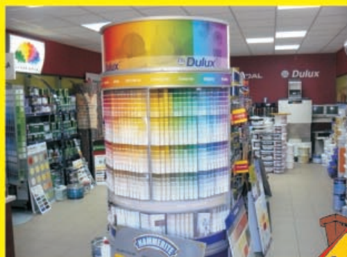
FIRMA "KOLOR" tel. 014 626-26-28