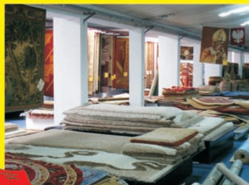
FIRMA "MARS" tel. 014 62-96-113