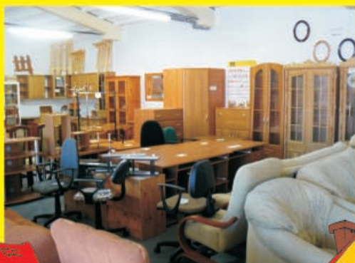
FIRMA "TRADEX" tel. 014 627-20-18