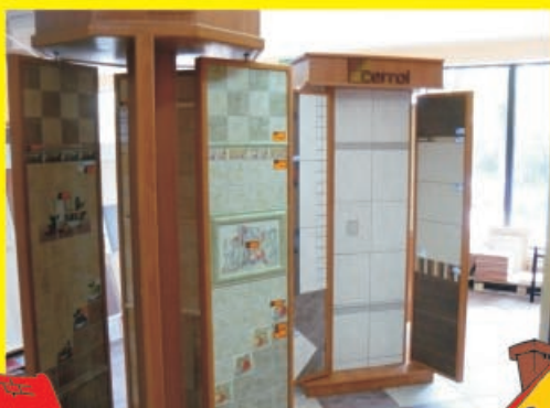
FIRMA "KOLOR" tel. 014 626-26-28