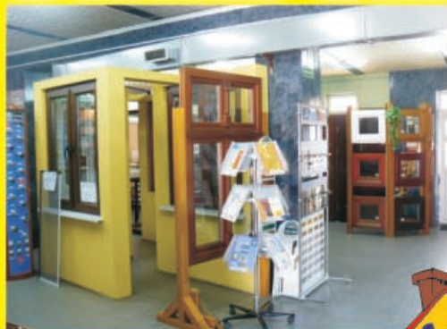
Firma "DOM-MAX" tel. 014 62-96-100