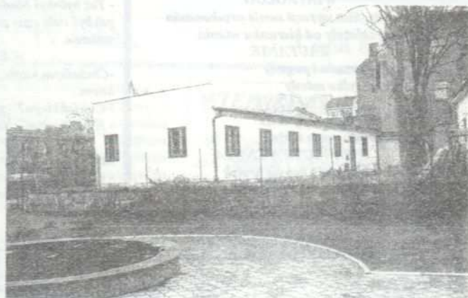
Budynek Komisariatu Policji

☛ W dniu 08.02.1994r. nieznani sprawcy dokonali włamania do Szkoły Podstawowej w m.Tarnowiec. Sprawcy po wybitciu otworu w ścianie dostali się do środka po czym dokonali kradzieży kserokopiarki, radiomagnetofonu i telewizora. Suma strat ok. 51 mln zł.