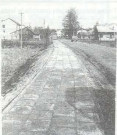
Chodnik w Jodłowce

W 1993r. wykonano 5 km dróg o nawierzchni asfaltowej we wsiach: Zgłobice, Koszyce Wielkie, Błonie, Poręba Radlna, Łękawka, Koszyce Małe, Wola Rzędzińska, Zbylitowska Góra. Ponadto prowadzono prace przy budowie chodników przy drogach wojewódzkich w Woli Rzędzińskiej (ok.2 km), Tarnowcu (800 mb), Koszycach Małych (ok.1 km) wraz z przebudową niebezpiecznego zakrętu-luku przy drodze Tarnów-Pleśna. B Bardel