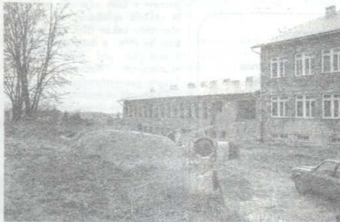
Szkoła w Tarnowcu

- Społeczna inicjatywa i finansowa pomoc