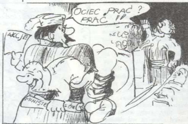
Z teki Jana Gajdura