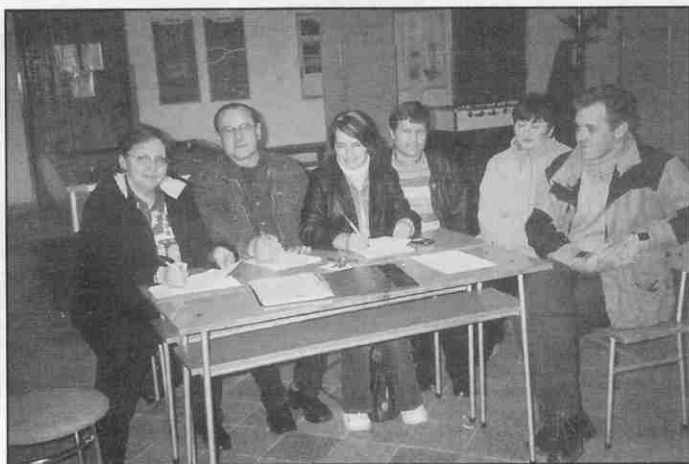
W Szkole Podstawowej nr 2 w Woli Rzędzińskiej również na brak chętnych do pomocy przy rozdzielaniu unijnych darów nie można było narzekać