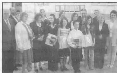
Nagrodzeni uczniowie, członkowie jury oraz przedstawiciele samorządu