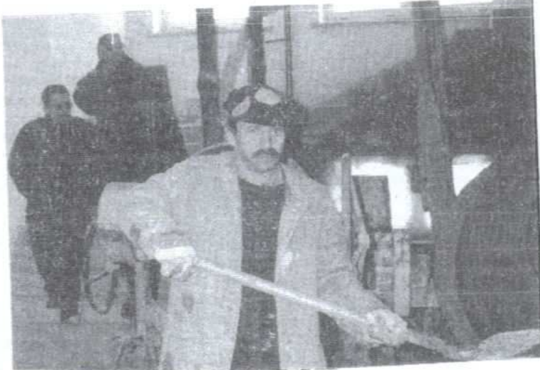
Na budowie szkoły w Łękawce

Przez Świebodzin i Rzychową "wycieczka" dotarła do Koszyc Małych. W rozbudowywanej szkole trwały roboty