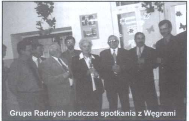
Grupa Radnych podczas spotkania z Węgrami

W efekcie m.in. tych działań musiało dojść do zmiany tegorocznej uchwały budżetowej. Dochody i wydatki zostały zwiększone o 176.843 zł. Największa kwota 135 tys. zł dotyczy wydatków na kanalizację Woli Rzędzińskiej oraz Zgłobice. Poza tym Rada Gminy uznała lasy w Łękawce, Porębie Radlnej, Radlnej, Zbylitowskiej Górze, Zgłobicach, za lasy ochronne. Wyraziła zgodę na zawarcie porozumienia z Wojewodą Małopolskim w sprawie utrzymania grobów i cmentarzy wojennych na terenie gminy. Zmieniła uchwałę w sprawie zbywania nieruchomości oraz uchwaliła zbycie działki w Koszycach Wielkich.