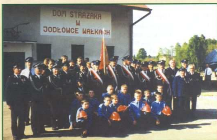
Strażacy OSP Jodłówka Wałki