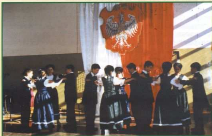
Tańczą węgierscy uczniowie - cd. na str. 9

Strażackie święto miało miejsce w remizie OSP Jodłówka Wałki. Rozpoczęcie imprezy odbyło się o godz. 13.00 raportem jednostek OSP przybyłych na uroczystość. Następnie przemaszerowały do kościoła parafialnego pw. Opatrzności Bożej w Jodłowce Wałkach na uroczystą mszę świętą za wszystkich strażaków.