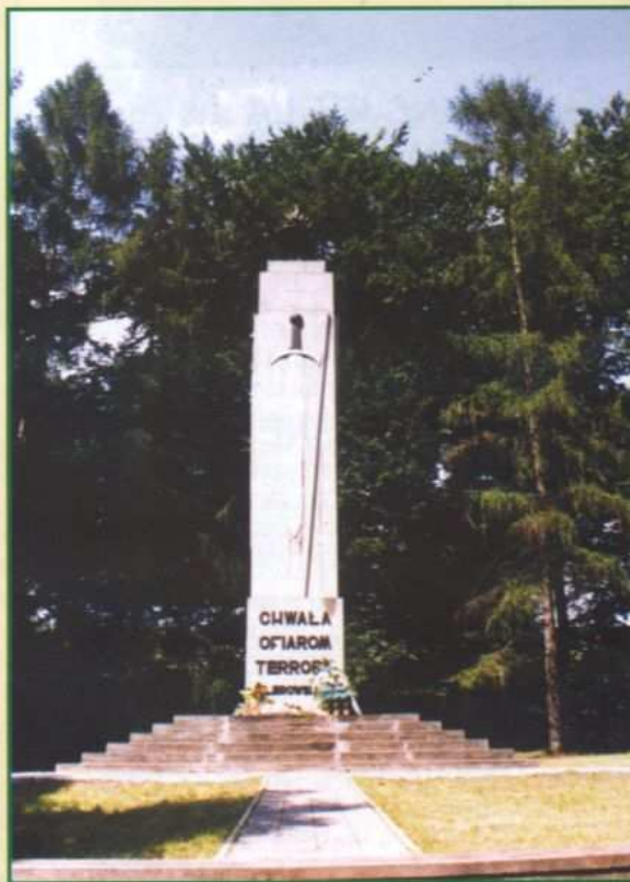
Pomnik w Buczynie