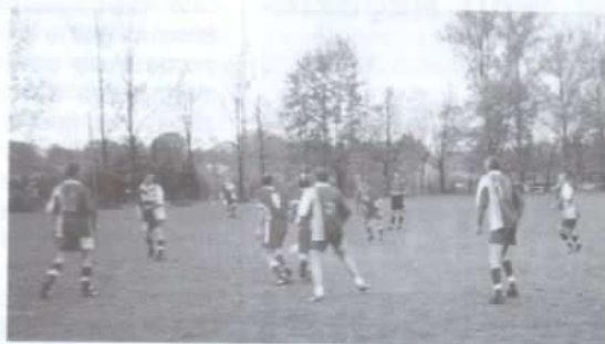
...i wydarzeniom na boisku