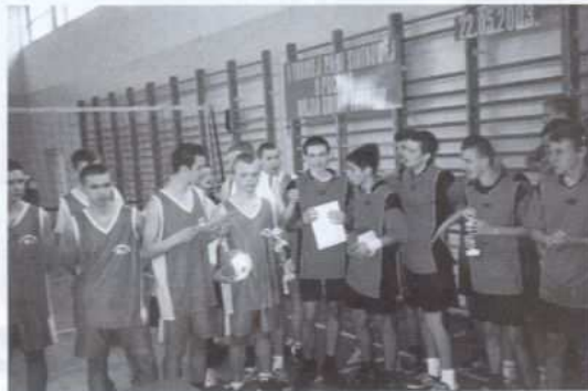
Gimnazjaliści ze Zbylitowskiej Góry dopięli swego...