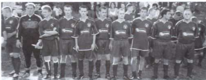
Piłkarze A klasowej już Victorii przed derbowym meczem

Następne derby Koszyc odbyć się mają już na boisku w Koszycach Wielkich, które buduje samorząd gminy Tarnów,