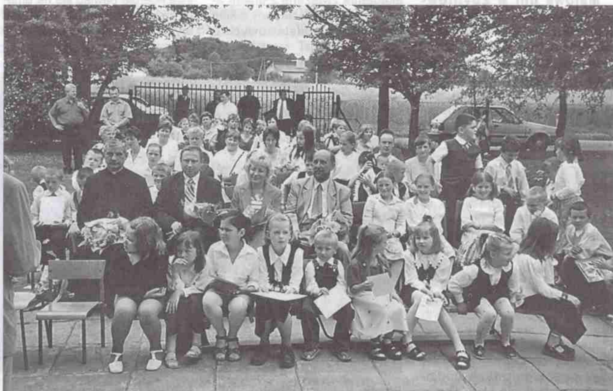
Zakończenie roku szkolnego w Szkole Podstawowej w Błoniu