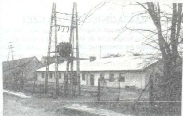
Biblioteka w Tarnowcu

Biblioteki w Tarnowcu i Woli Rzędzińskiej obchodzą właśnie jubileusz 40-lecia pracy.