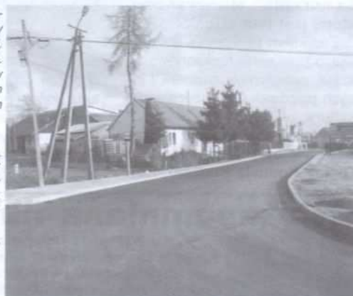
Odnowiony fragment ul. ks. Kędronia w Koszycach Wielkich

Kolejna inwestycja zrealizowana została w Koszycach Wielkich. Na odcinku ul. ks. Kędronia – od likwidowanego stawu do remizy strażackiej – ułożona została nowa nawierzchnia asfaltowa wraz z chodnikiem. Szczególnie ważne jest to, iż udało się połączyć ul. ks. Kędronia z niedawno przebudowaną ul. Pocztową,