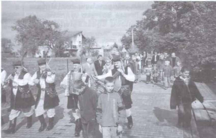
11 października mieszkańcy Koszyc Wielkich cieszyli się z uroczystego oddania do użytku przebudowanej ulicy Pocztowej, która teraz może być prawdziwą wizytówką tej miejscowości