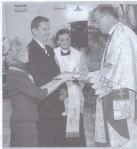
Gminną uroczystość dożynkową w Zgłobicach zaszczylił swoją obecnością biskup ordynariusz Wiktor Skworc

* Stowarzyszenie "Pomocna Dłoń", działające na terenie gminy Tarnów, zorganizowało w sali konferencyjnej Starostwa Powiatowego wystawę pt "Świat kolorów i barw widziany oczami dziecka niepełnosprawnego". Inicjatywę kwotą 2,5 tys. zł wsparła Fundacja Batorego.