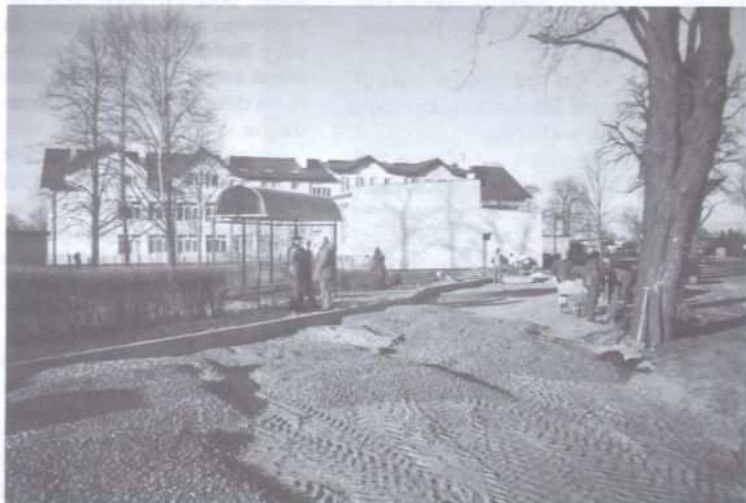
Prace przy urządzeniu zatoczki autobusowej w Zgłobicach wykonywali – zatrudnieni przez Urząd Gminy – bezrobotni w ramach prac interwencyjnych

W Zgłobicach, pasażerowie korzystający z usług komunikacji miejskiej, wreszcie mogą oczekiwać na autobus w miejscu przypominającym swoją estetyką czasy w których żyjemy.