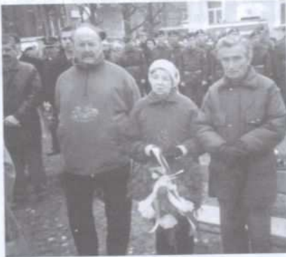
W gminnych obchodach Narodowego Święta Niepodległości w Woli Rzędzińskiej uczestniczyli także przedstawiciele rodzin legionistów z Tarnowa