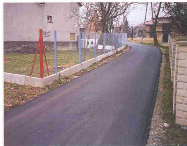
...i ul. Żołędziowej w Zbylitowskiej Górze