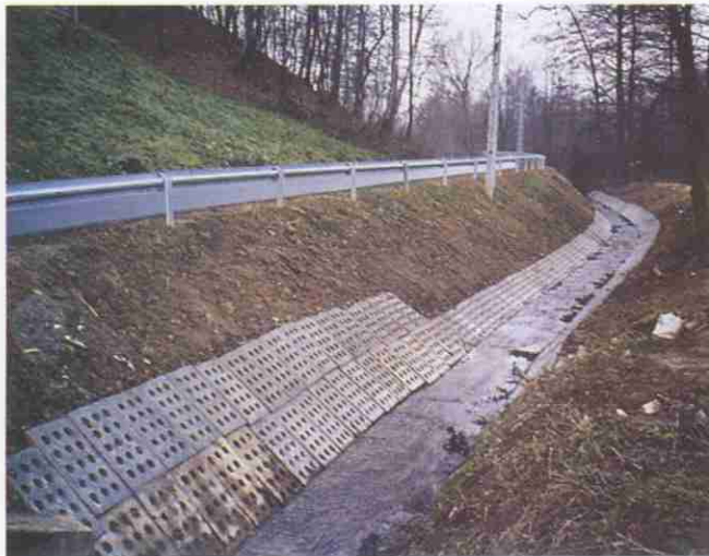
Regulacja koryta potoku „Radlanka” w Radnej