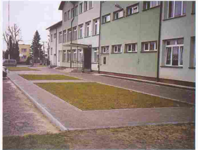
Zagospodarowany teren przed Szkołą Podstawową w Zgłobicach