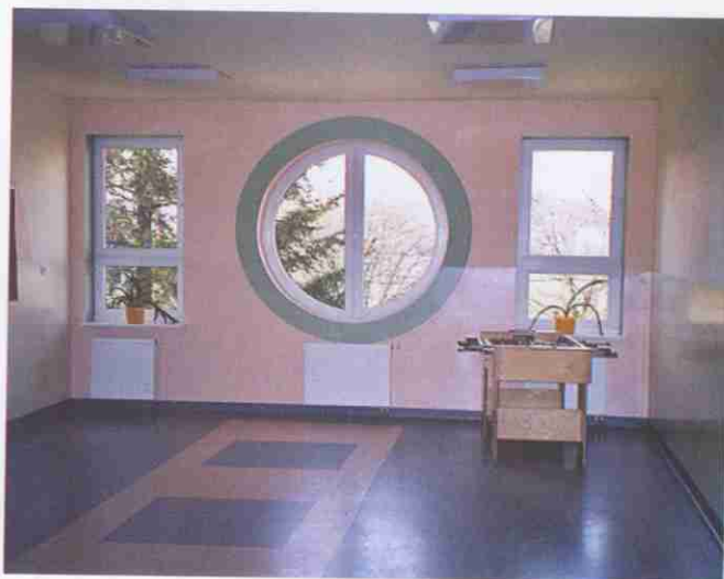
Kolorystyka wewnątrz w szkole w Błoniu została tak dobrana, aby były one jak najbardziej przyjazne uczniom