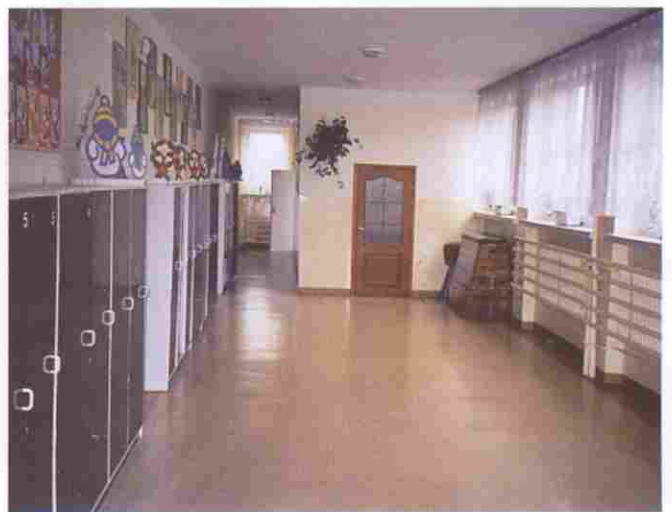
Gruntowny remont przeszedł korytarz dolny w Szkole Podstawowej w Zawadzic (szkoła ta zyskała w tym roku także nowy dach)