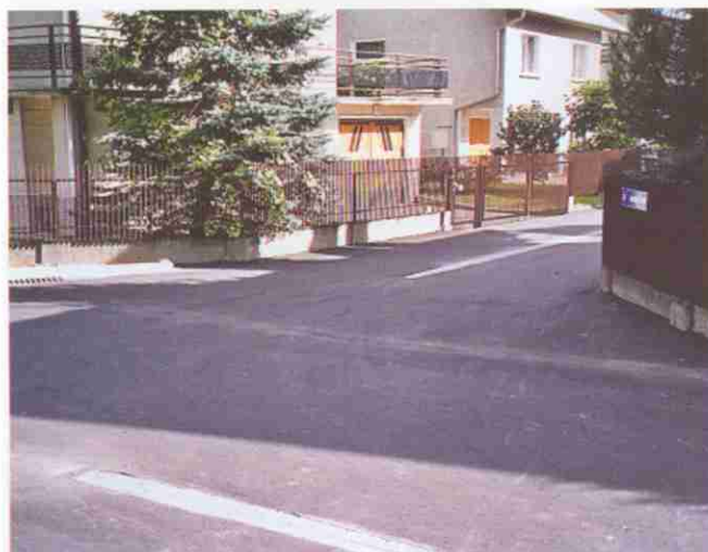
Ul. Azaliowa i Moszczeńskich w Zbylitowskiej Górze – mieszkańcy społecznie wykonali wiele prac z wykorytowaniem i nawieżeniem odpowiedniego podłoża pod asfalt