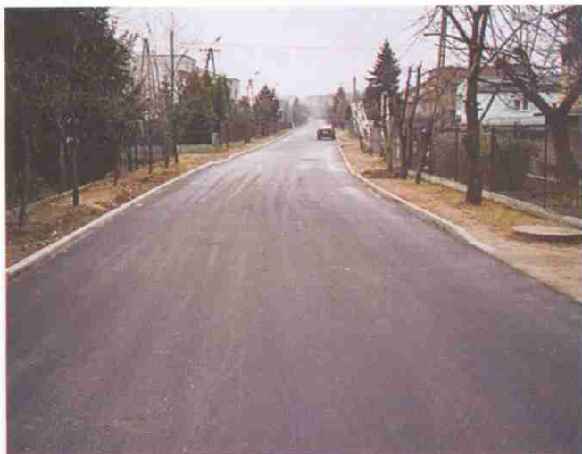
Tak po remoncie wygląda ul. Długa w Zgłobicach