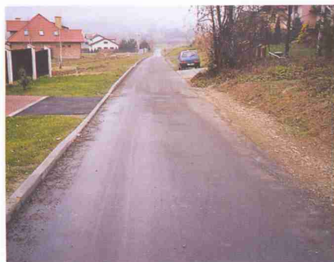
Nowy asfalt na ul. Sportowej w Tarnowcu