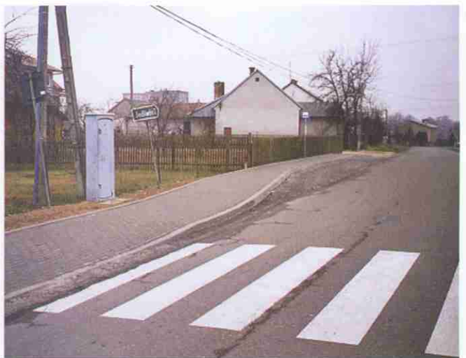
Zatoczka autobusowa wraz z chodnikiem obok obiektu szkolnego w Woli Rzędzińskiej II