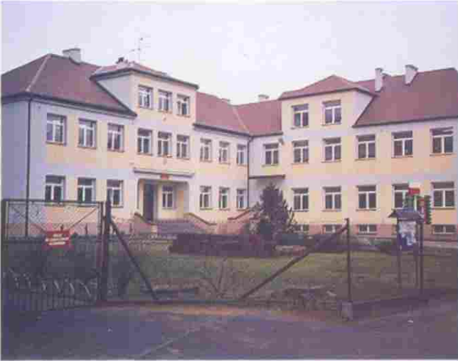
Po remoncie Szkoła Podstawowa nr 1 w Woli Rzędzińskiej prezentuje się o wiele bardziej okazale