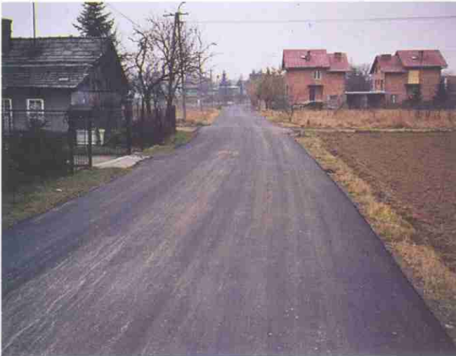
Nawierzchnia asfaltowa pokryła w ostatnich dniach znaczą część ul. Liściastej w Koszycach Wielkich