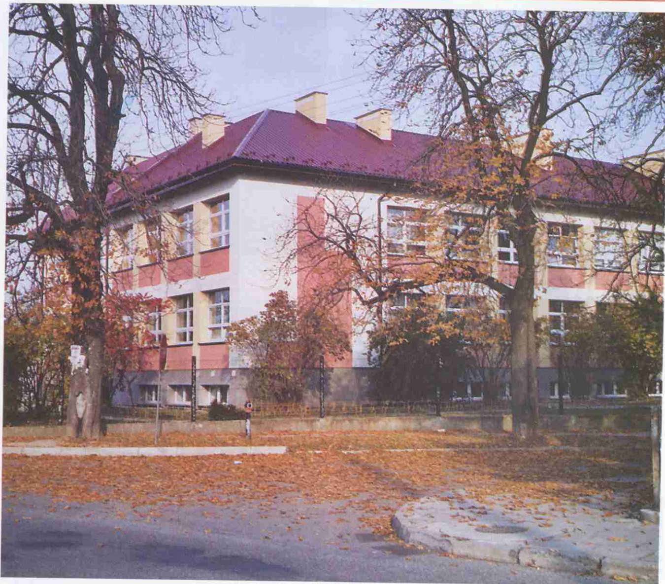
Obiekt oświatowy w Zbylitowskiej Górze z nowym dachem, oknami i elewacją