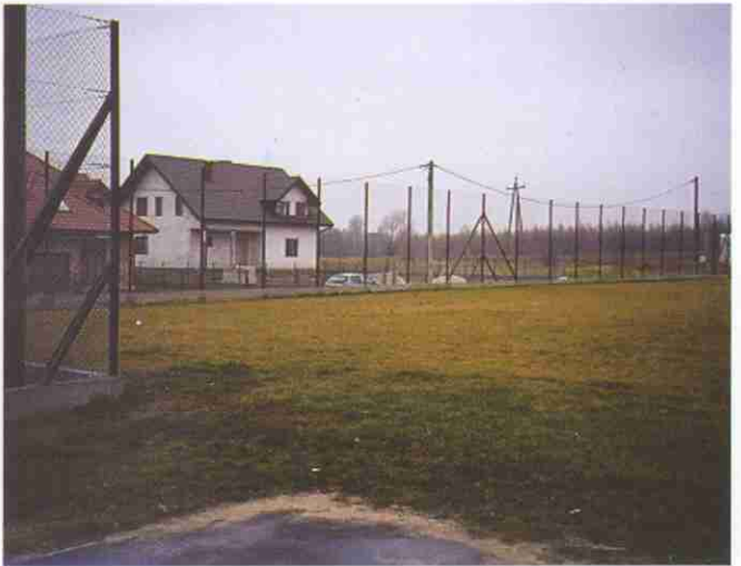
Ogrodzenie budowanego boiska sportowego w Koszycach Wielkich od strony południowej