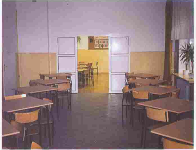
Uczniowie SP nr 1 w Woli Rzędzińskiej mogą spożywać posiłki w nowej stołówce