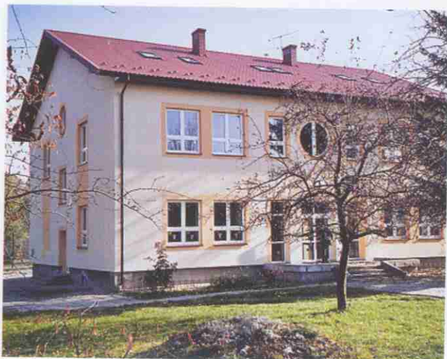
Wyremontowany budynek Szkoły Podstawowej w Błoniu