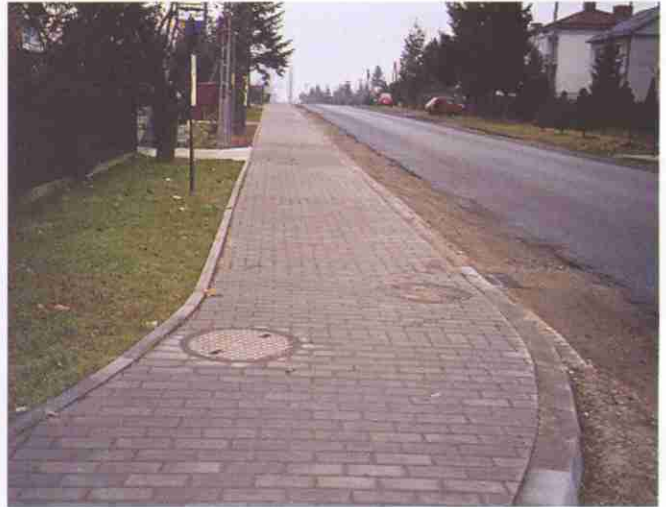
Dzięki wybudowaniu chodnika znacznie poprawiło się bezpieczeństwo użytkowników ul. Tarnowskiej w Koszycach Wielkich