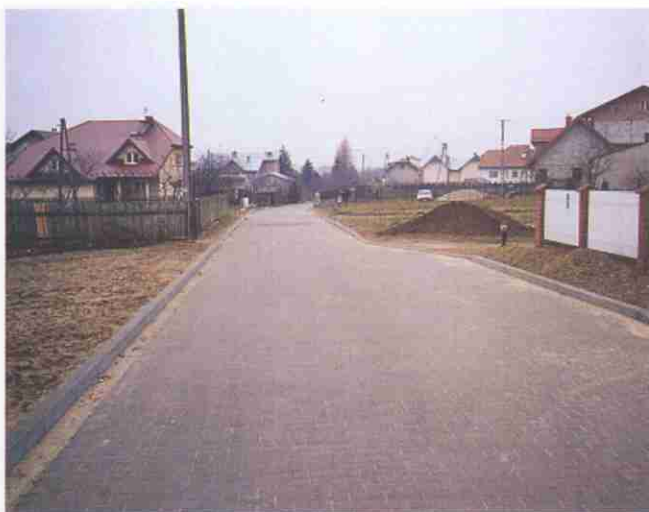
Kolejny odcinek „Leśnicy” w Woli Rzędzińskiej pokryła kostka brukowa