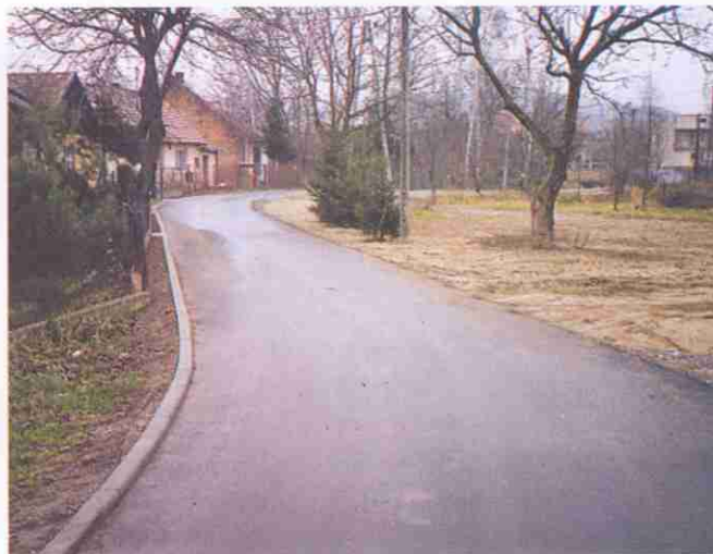
Ul. Nadbrzeżną w Tarnowcu pokrywa już nawierzchnia asfaltowa