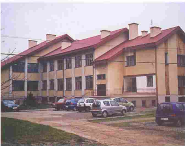
Szkołę Podstawową w Porębie Radnej pokrył nowy dach