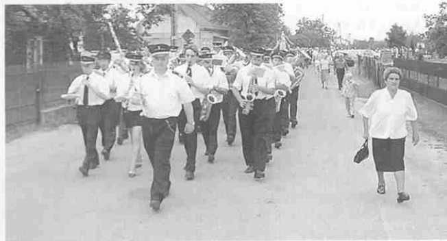
Orkiestra dęta z Woli Rzędzińskiej podczas uroczystości patriotycznej w Białej

- Widzę, że powoli zmienia się mentalność ludzi, co dla mnie jest bardzo ważne. Zaczy-