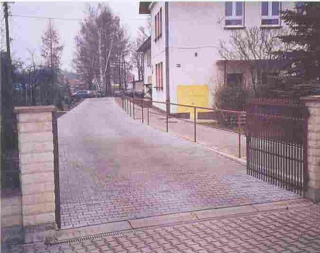
Wejście do obiektu oświatowego w Woli Rzędzińskiej II pokryła w tym roku kostka brukowa