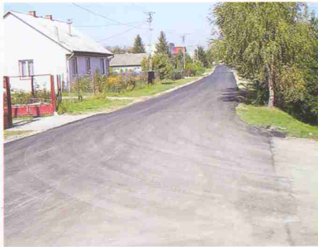
Asfalt na ul. Granicznej łączącej trzy miejscowości: Koszyce Wielkie, Zgłobice i Koszyce Małe