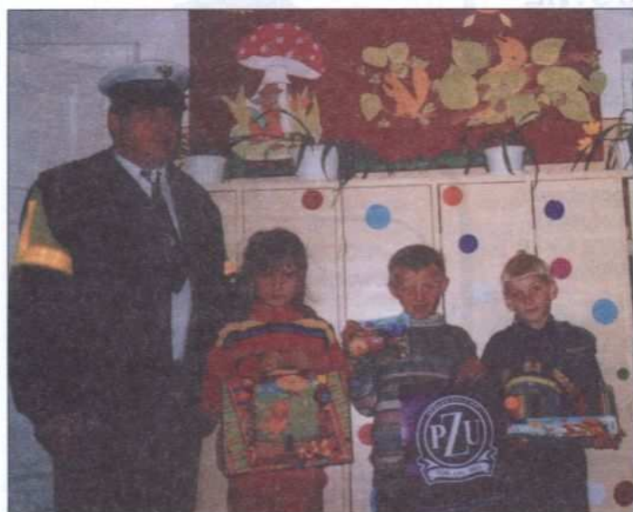
Uczestnicy akcji "Bezpieczna droga"