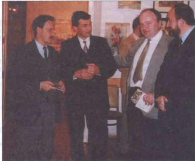
Wójtowie na wystawie "Tęczy" w Krakowie