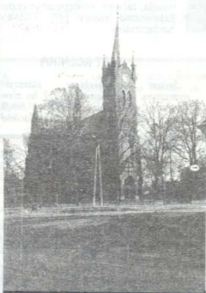
Czy centrum nowej gminy ?