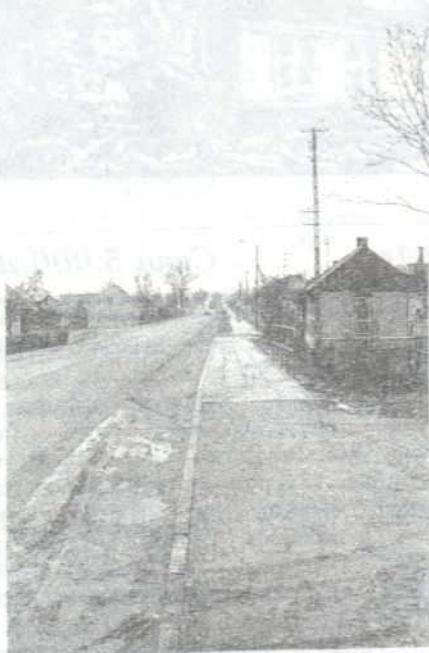
Chodnik w Tarnowcu

Cieszymy się, że drogi gminne są asfaltowane, ale ruch kołowy jest na nich bardzo duży i coraz szybszy. Koło tych dróg powstają nowe chodniki. Co z