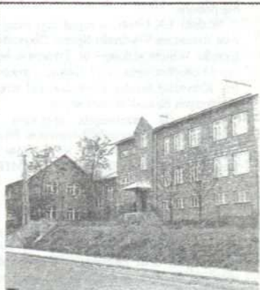
Świętowano w tej szkole