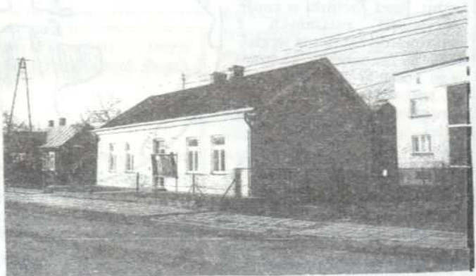
Czy w tym budynku będzie Urząd Gminy Wola Rzędzińska?

Po dyskusji odbyło się głosowanie, w efekcie którego Sejmik Samorządowy województwa tarnowskiego skierował do Urzędu Rady Ministrów pozytywną opinię do wniosku o utworzenie gminy Wola Rzędzińska. Sprawa podziału naszej gminy rozpatrywana jest teraz w URM. Tam zapadnie decyzja. Jaka będzie? Czas pokaże.