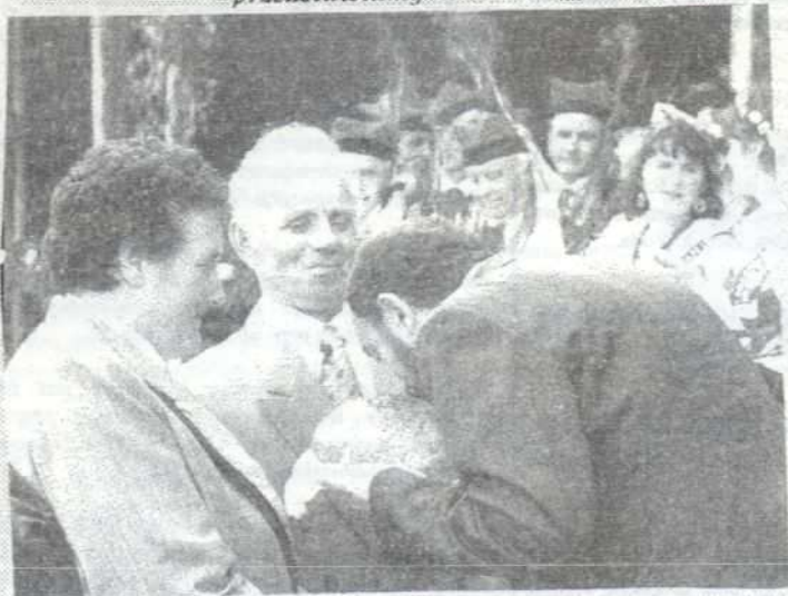
STAROSTOWIE I GOSPODARZ DOŻYNEK

Szerszą informację o dożynkowych uroczystościach przedstawiamy na str. 8.