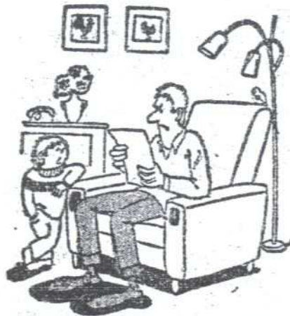
- I snów zarobiesz, tato, na tej dwóch godzin tygodniówkę!