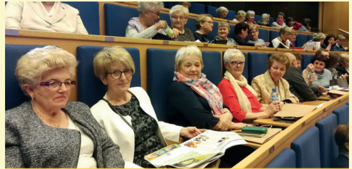
Seniorzy z gminy Tarnów na V Forum Seniora w Krakowie