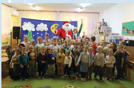
PRZEDSZKOLE - TARNOWIEC