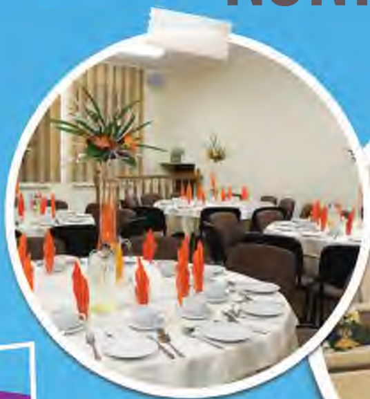
Dom Kultury w Zbylitowskiej Górze