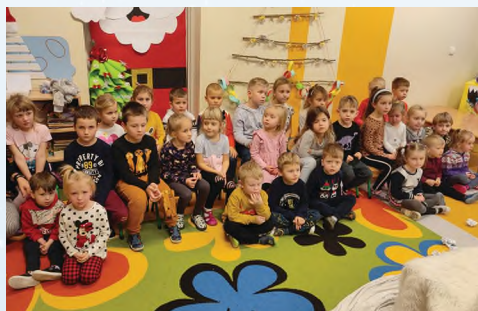
PRZEDSZKOLE - BIAŁA

Do wszystkich przedszkoli i żłobków na terenie gminy Tarnów w dniach 8-10 grudnia na specjalne zaproszenie wójta Grzegorza Kozioła zawitali wysłannicy św. Mikołaja wraz z teatralną niespodzianką – spektaklem „Elf Psotek i czarodziejski młotek”. Nie zabrakło też drobnych upominków dla każdego przedszkolaka. Warto dodać, że projekt zrealizowano przy wsparciu finansowym Województwa Małopolskiego.