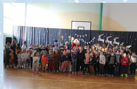
SZKOŁA PODSTAWOWA - ZAWAŃDA