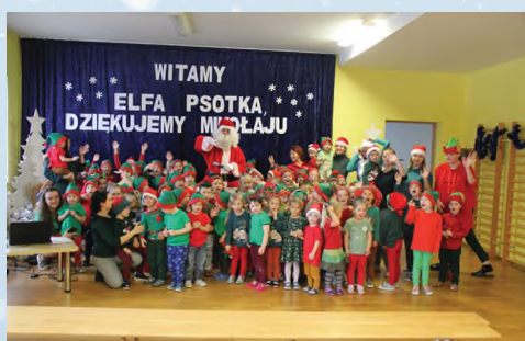
PRZEDSZKOLE - RADLNA - SŁONECZKO