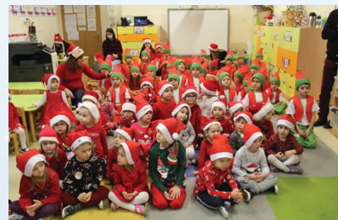
PRZEDSZKOLE - JODŁÓWKA-WAŁKI