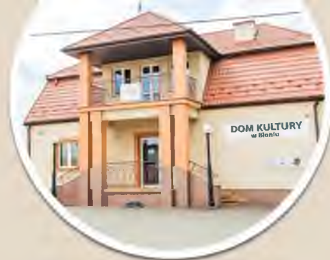
Dom Kultury w Błoniu

Centrum Kultury i Bibliotek Gminy Tarnów zaprasza do wynajmowania sal bankietowych i konferencyjnych w Domach Kultury