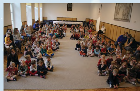
PRZEDSZKOLE - ZBYLITOWSKA GÓRA