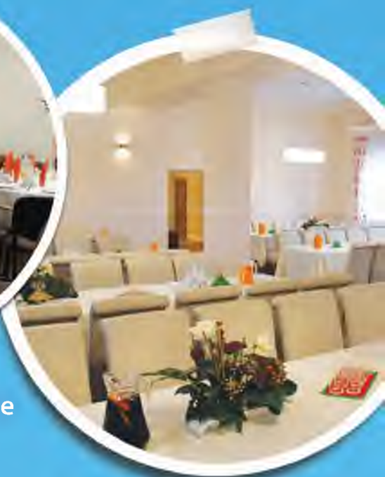
Dom Kultury w Radlnej