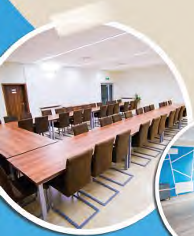
Dom Kultury w Koszycach Małych