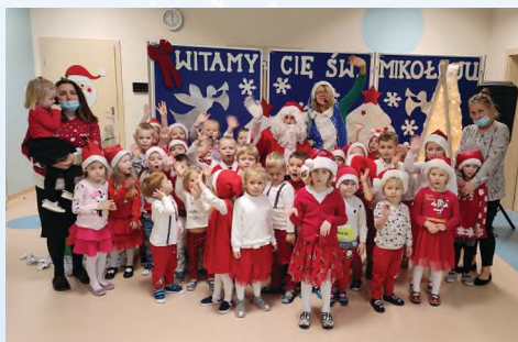
ZESPÓŁ SZKOLNO-PRZEDSZKOLNY - BŁONIE