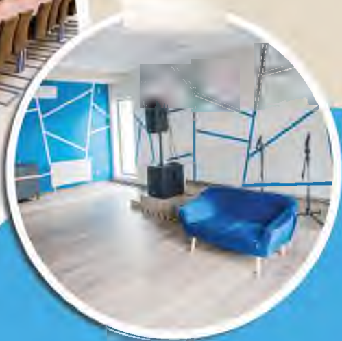
Dom Kultury w Zgłobicach