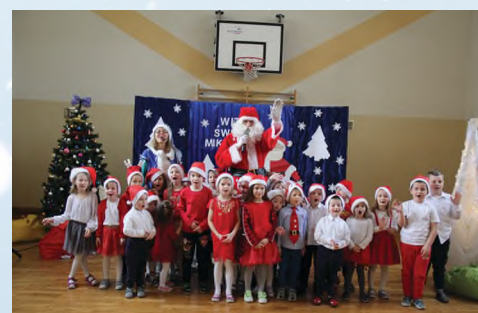
SZKOŁA PODSTAWOWA - PORĘBA RADLNA