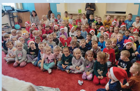
PRZEDSZKOLE - WOLA RZĘDZIŃSKA I