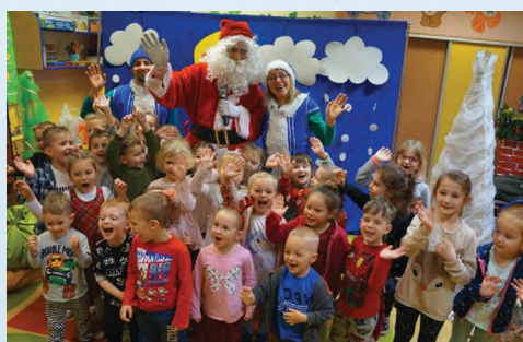
PRZEDSZKOLE - KOSZYCE MAŁE