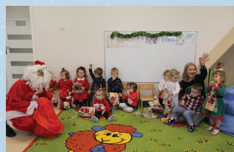
ŻŁOBEK - WOLA RZĘDZIŃSKA - MALUSZEK