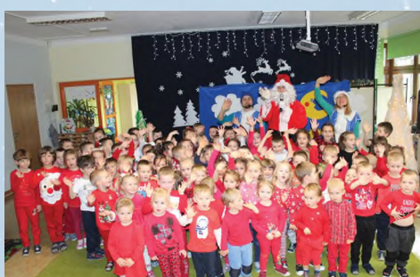
PRZEDSZKOLE - ZGŁOBICE - KRAINA MARZEŃ