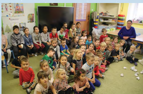
PRZEDSZKOLE - WOLA RZĘDZIŃSKA II