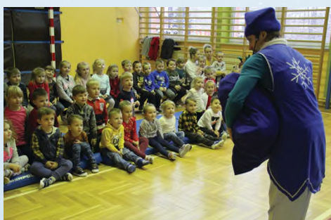
ZESPÓŁ SZKOLNO-PRZEDSZKOLNY - ŁĘKAWKA