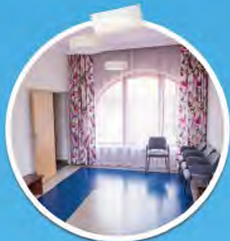
Dom Kultury w Koszycach Wielkich