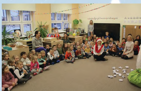
PRZEDSZKOLE - ZBYLIT. G. - POD KASZTANAMI