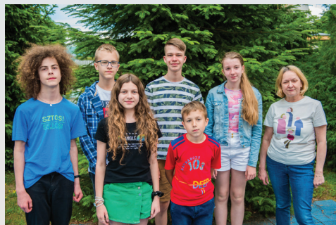
Niepubliczna Szkoła Podstawowa w Koszycach Małych