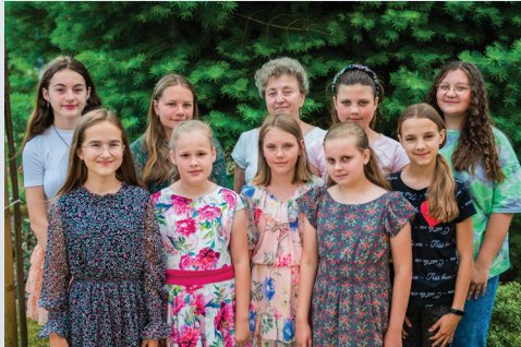
Niepubliczna Szkoła Podstawowa im. bł. ks. Jerzego Popiełuszki w Łękawce

Rok ciężkiej pracy z pewnością wymagał od nich wielu wyrzeczeń i godzin spędzonych przy nauce – jednak było warto. Teraz należą do grona najlepszych, a ich trud i obowiązkowość z pewnością zaowocuje w przyszłości. Poniżej uczniowie ze wszystkich szkół z terenu gminy Tarnów, którzy w roku szkolnym 2021/2022 uzyskali najwyższe średnie w nauce: