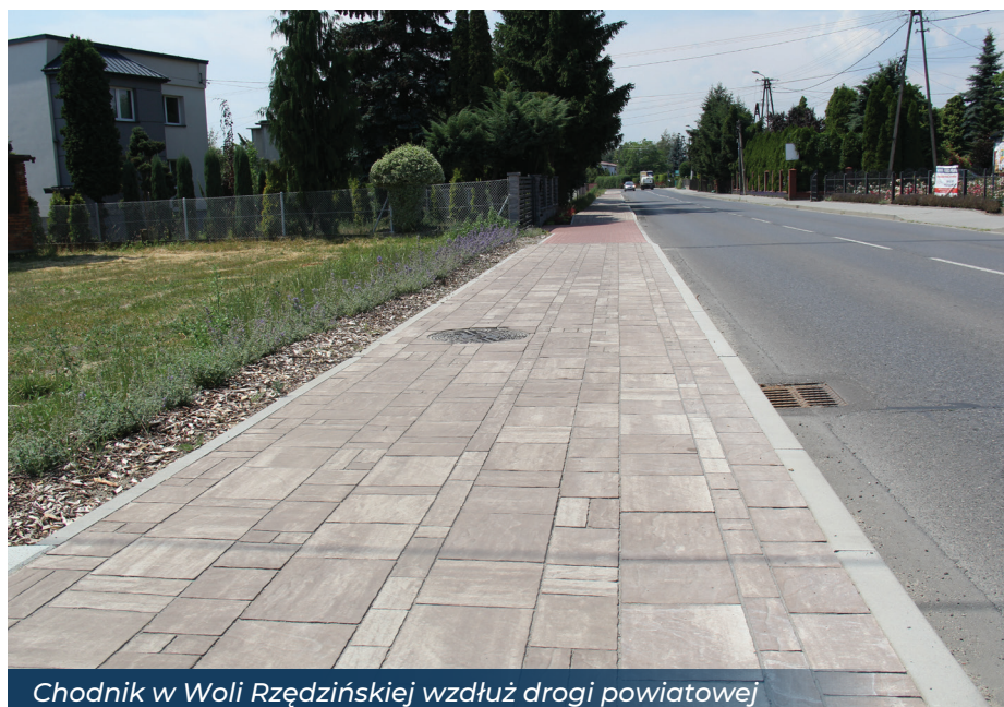
Chodnik w Woli Rzędzińskiej wzdłuż drogi powiatowej

Tak dużego wsparcia finansowego z budżetu państwa na działania rozwojowe naszego gminnego samorządu nie było nigdy w historii. W pierwszej edycji Rządowego Funduszu Inwestycji Strategicznych „Polski Ład” otrzymaliśmy 10 mln zł. Inwestycje są w trakcie realizacji.