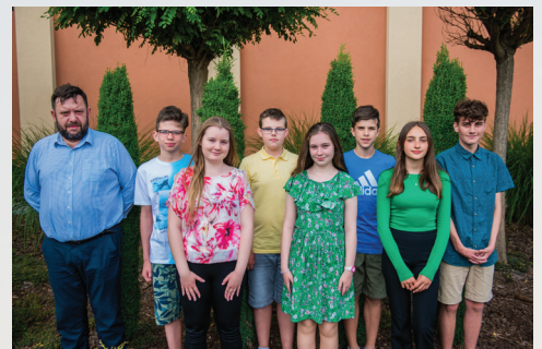
Szkoła Podstawowa im. mjr Henryka Sucharskiego w Koszycach Wielkich