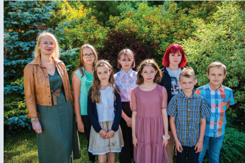
Niepubliczna Szkoła Podstawowa w Jodłówce-Wałkach