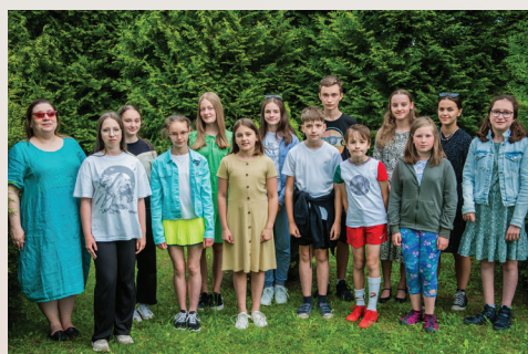
Publiczna Szkoła Podstawowa im. K.K. Baczyńskiego w Zgłobicach