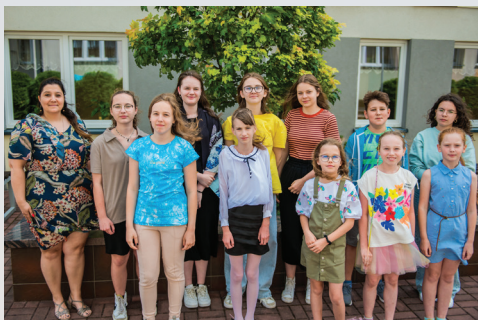
Szkoła Podstawowa im. hetmana Jana Tarnowskiego w Tarnowcu