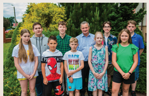
Szkoła Podstawowa im. KEN w Zbylitowskiej Górze