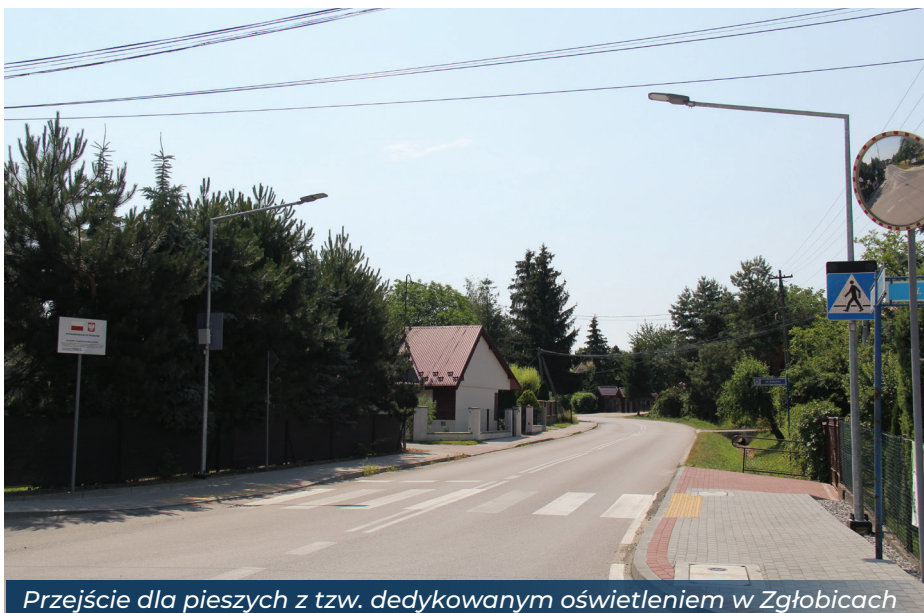
Przejście dla pieszych z tzw. dedykowanym oświetleniem w Zgłobicach

Z Ministerstwa Kultury i Dziedzictwa Narodowego dofinansowania do prowadzonej działalności pozyskuje też Centrum Kultury i Bibliotek. Dzięki temu udało się w ostatnim czasie uzyskać dotacje na takie programy, jak „Promocja czytelnictwa 2022” – 30 tys. zł, „Literatura” – 30 tys. zł, „Kultura dostępna” – 60 tys. zł czy „Kultura ludowa i tradycyjna” – 45 tys. zł.