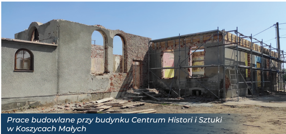
Prace budowlane przy budynku Centrum Historii i Sztuki w Koszycach Małych

na budowę oraz modernizację infrastruktury drogowej, kanalizacyjnej, kulturalnej i społecznej.