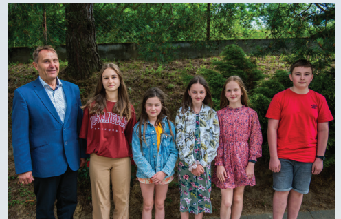
Szkoła Podstawowa im. o. Zbigniewa Strzałkowskiego w Zawadzie