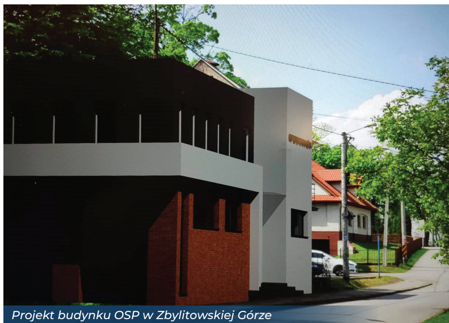
Projekt budynku OSP w Zbylitowskiej Górze

Pozyskane środki zewnętrzne umożliwiły rozpoczęcie długo oczekiwanej przez mieszkańców modernizacji zabytkowego budynku dworu wraz z zagospodarowaniem terenu w Koszycach Małych. Znajdą się w nim pomieszczenia przeznaczone na cele wystawiennicze i ekspozycyjne - Centrum Historii i Sztuki. Wartość inwestycji – 5 mln zł.