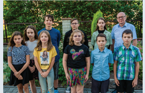
Szkoła Podstawowa nr 2 im. bł. Edmunda Bojanowskiego w Woli Rzędzińskiej