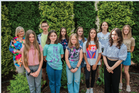
Publiczna Szkoła Podstawowa nr 1 im. Heleny Marusarz w Woli Rzędzińskiej