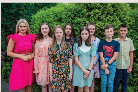
Niepubliczna Szkoła Podstawowa im. Jana Pawła II w Błoniu