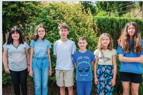
Szkoła Podstawowa im. ks. Jana Twardowskiego w Porębie Radlnej