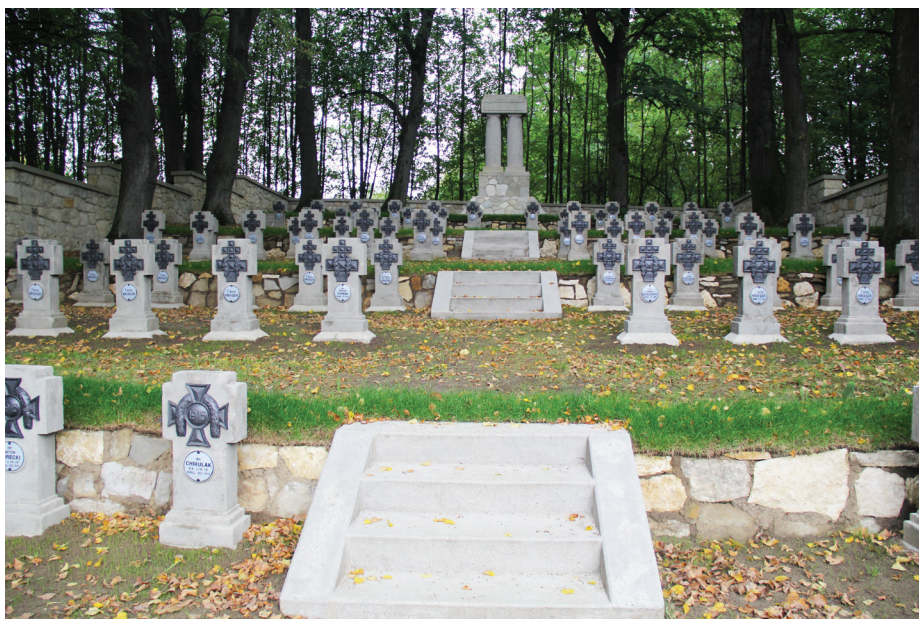
Wyremontowany cmentarz wojenny w Koszycach Małych

Przewidywana wartość inwestycji – 1,3 mln zł. Kwota przyznanego dofinansowania to przeszło 1,27 mln zł (98 procent).