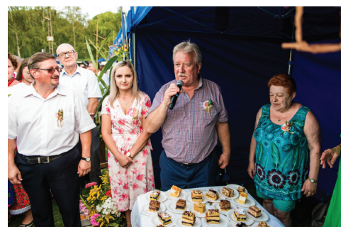
Wola Rzędzińska II