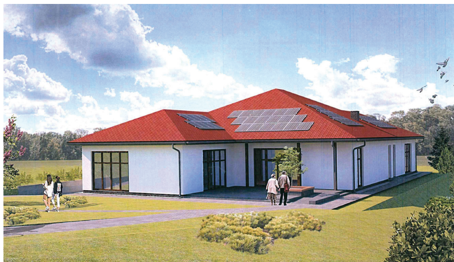
Projekt Domu Kultury w Zawadzie

W ramach funduszy pozyskanych przez samorząd z pierwszej edycji „Polskiego Ładu” trwają prace przy budowie oraz modernizacji infrastruktury kulturalnej i turystycznej. Pierwszą inwestycją w tym zakresie jest przebudowa i adaptacja zabytkowego dworu w Koszycach Małych (wraz z zagospodarowaniem terenu) z przeznaczeniem na obiekt dla potrzeb lokalnej społeczności oraz Centrum