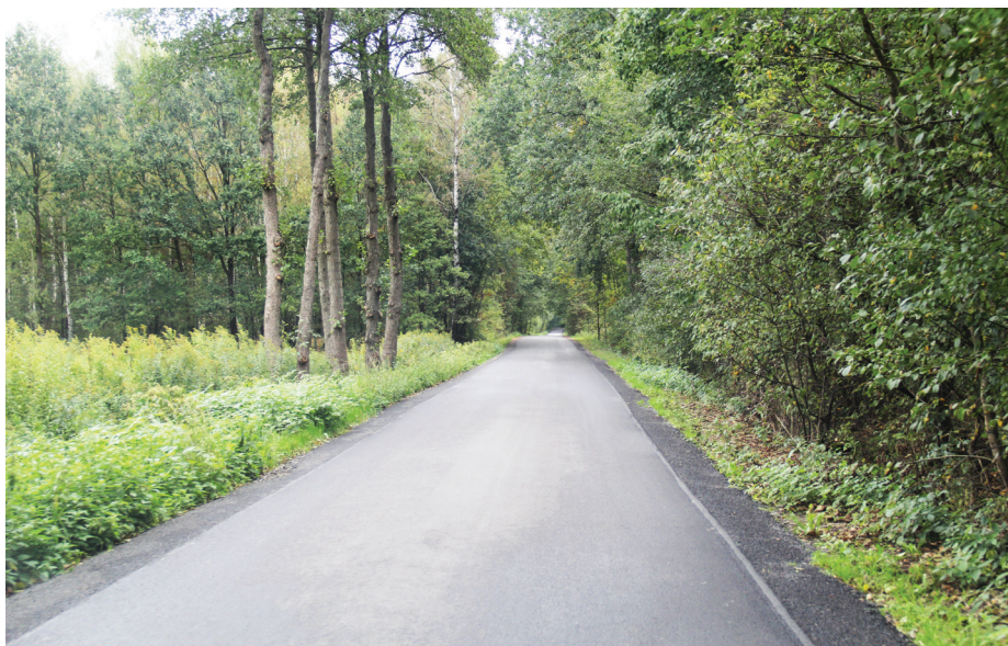
Droga „Przez Las” w Woli Rzędzińskiej

Ogłoszony został przetarg na budowę parkingu przy Zespole Szkolno-Przedszkolnym w Jodłówce-Wałkach. Na parking będzie zlokalizowana stacja ładowania pojazdów elektrycznych. Zadanie obejmie również wykonanie utwardzenia terenu z przeznaczeniem na parking dla