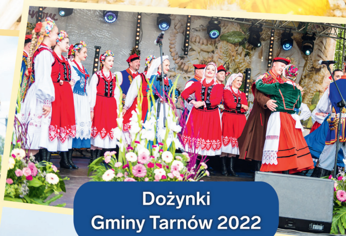
Dożynki Gminy Tarnów 2022