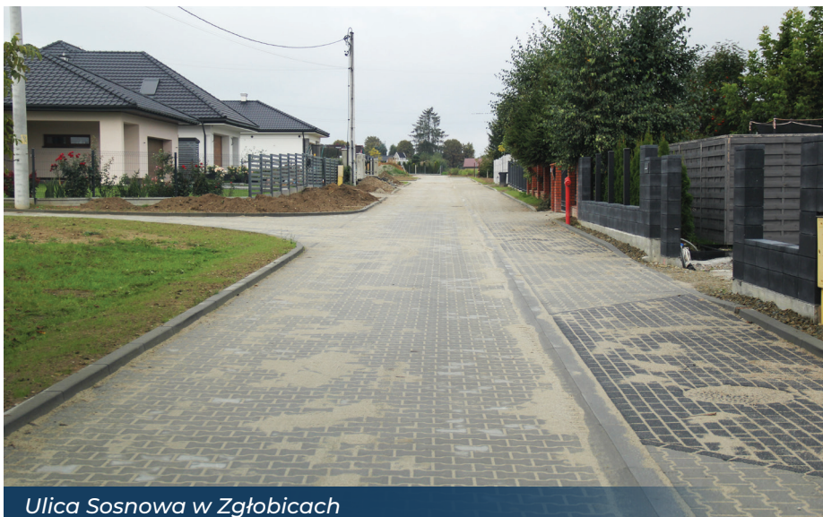
Ulica Sosnowa w Zgłobicach

Dobiegła końca przebudowa ul. Sosnowej w Zgłobicach, gdzie nawierzchnia wykonana została z kostki betonowej.