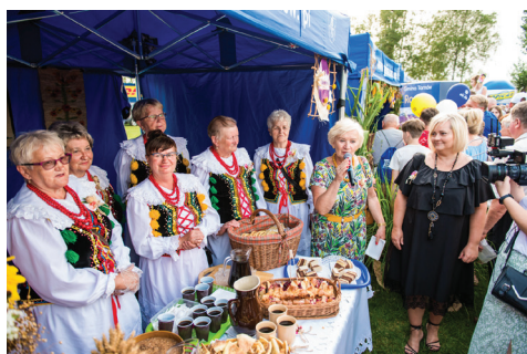
Wola Rzędzińska I