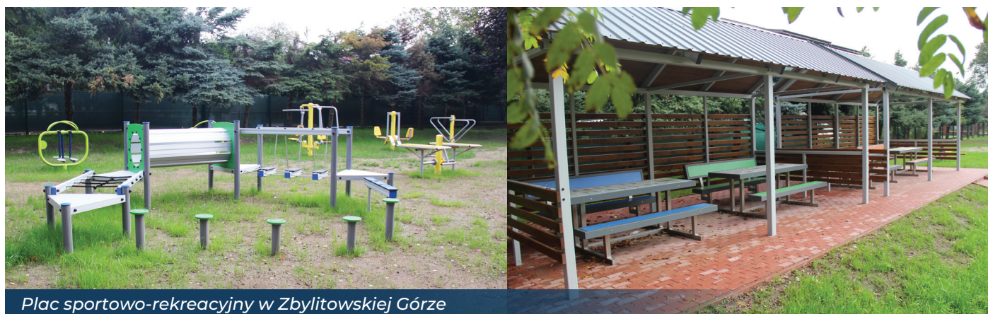
Plac sportowo-rekreacyjny w Zbylitowskiej Górze

Zakończył się remont konserwatorski cmentarza wojennego nr 196 z okresu I wojny światowej w Koszycach Małych. Odnowiono pomnik centralny, mur ogrodzeniowy i słupki, nagrobki i krzyże